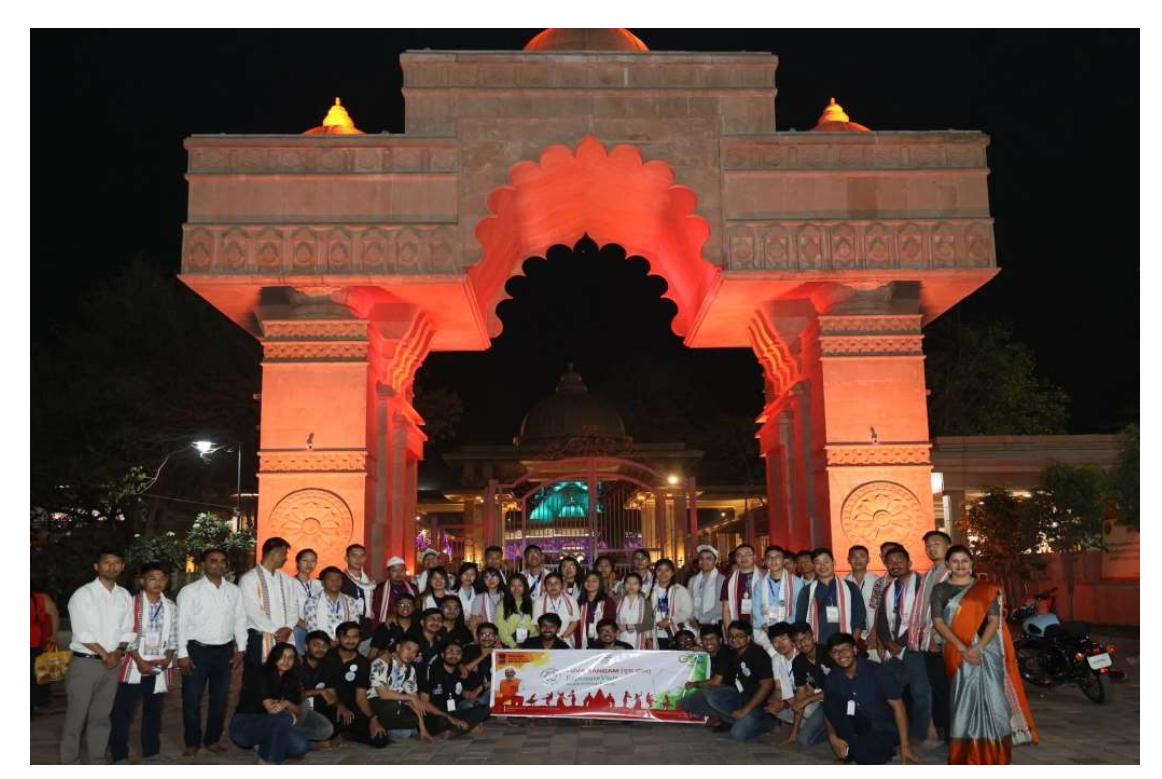
At Koradi Temple